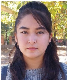
Amir Temur, Fitrat, Bobur iziman, Bobom Mashrab, Qodiriyning so'ziman. Men o'zbekman, To'marisning qiziman,

Yuksalishing ko'rib yayraydi dilim, Janglarda o'lmagan NAVOIY TILIM!