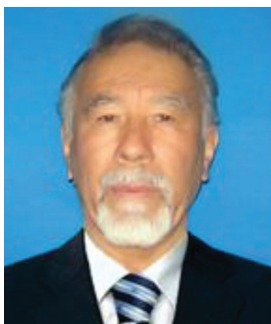
Ona tilim – qalbm tili bu, Ona tilim – xalqim tili bu. Men o'rgandim uni onamdan, Asrang uni befarq, beg'amdan.

O'zbekda yo'q "nouen" degan so'z, O'zbekda yo'q "couen" degan so'z. Ona tilim – bu iymon tili, Ona tili – bu vijdon tili.